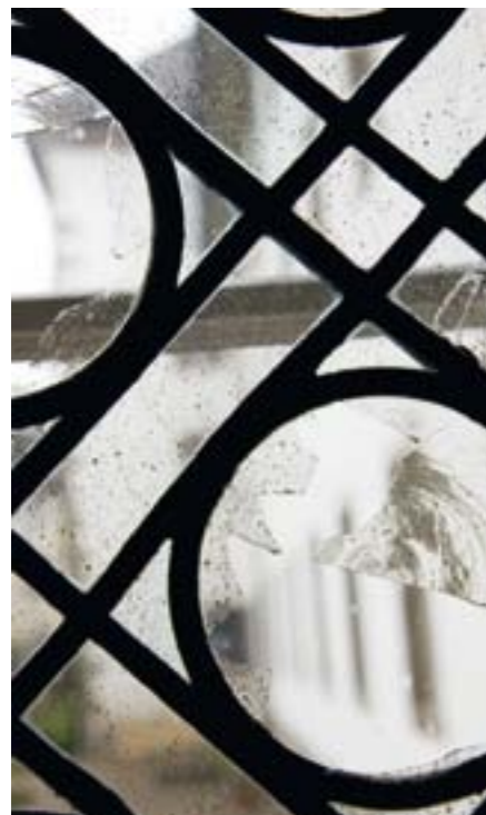
05 Einsiedeln: tracce di grandine sulle finestre