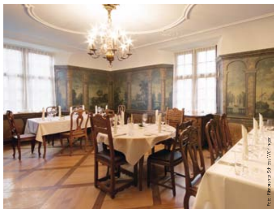
Arredamento di pregio: la stanza delle rose nel ristorante Schloss Wülflingen.

Per maggiori informazioni sul premio per il marketing della GfM (in tedesco): www.gfm.ch/de/portrait/marketingpreis