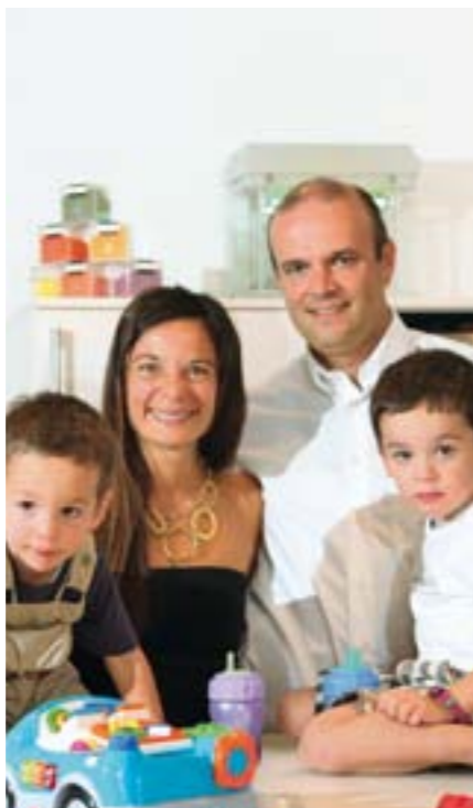
10 Famiglia Tulipani: essere genitori previdenti