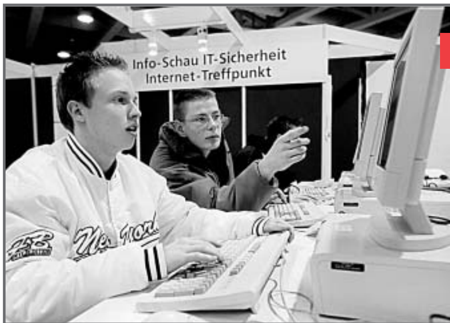
Das Bewusstsein für grösstmögliche IT-Sicherheit muss früh geweckt werden.

Der Wert von Daten wird von KMU oft erst erkannt, wenn sie nicht mehr da sind. Der «IT-Security Health Check» weist auf Sicherheitslücken hin und zeigt – oft einfach umzusetzende – Gegenmassnahmen auf.